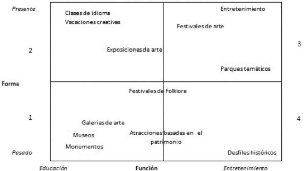
Figura 1. Tipología de turismo cultural según Richards (2001)

Así destacamos la importancia de los eventos y festivales, generalmente más asociados a ocios populares, y utilizados por los destinos, cada vez en mayor medida, para atraer a los consumidores. La promoción de los eventos y festivales en este sentido esta “cada vez más dirigida a objetivos sociales que económicos” (Richards, 2006, pág.277).