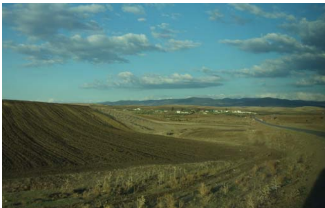
Fotografías 5 y 6. La campiña cerealista y campos de labor en el borde del Rif