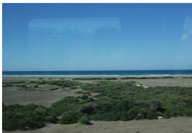
Fotos 1 y 2 Playas en la costa noratlántica marroquí.