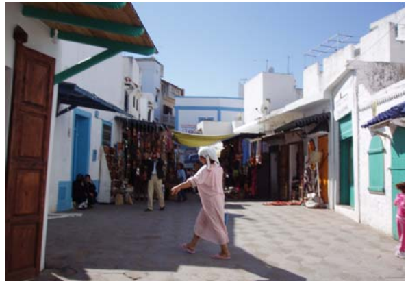
F. 9 y 10. Asilah. Emplazamiento histórico y calle turística del interior de la medina.