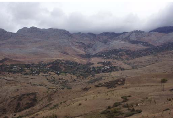
Fotografías 3 y 4: El paisaje rural en las montañas del Rif. (l. del Río,

El viaje, con salida y vuelta a España, desde Tarifa a Algeciras respectivamente, duró dos intensos días en los que se observaron formas litorales, montañas, bosques, ríos y ramblas, campiñas, pueblos y ciudades de la península de Tánger, al norte de Marruecos, pero, sobre todo, se apreció a través de sus paisajes la genuina relación de los elementos de su organización territorial. Se reconocieron litorales aún vacíos y costas con distinta intensidad de desarrollo turístico, sistemas de poblamiento rural vinculados con una agricultura tradicional aún bastante activa, grandes y medianas ciudades costeras con la impronta de un reciente y vigoroso crecimiento turístico, ciudades del interior que conservan lo fundamental de la estructura urbana de sus centros históricos y un sistema de comunicaciones terrestres todavía escasamente modernizado. Bajo la forma de estos paisajes subyace, y hay infinidad de elementos que lo ponen de manifiesto, una determinada estructura social definida por el nivel de vida, la cultura y las relaciones humanas, propia de un país considerado, según nuestros parámetros, en vías de desarrollo.