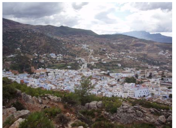
Fotografías 11 y 12. Chechaouen. Vista panorámica y plaza en la medina. (I. del Río, 2007)